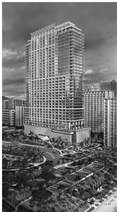
Международная гостиница и башня «Trump», Вайкики

«Трамп добрался до Гавайских островов», «Multi-Housing News», ноябрь 2006, с. 16.