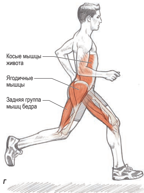
Рисунок 1.3. Шаговый цикл бега, иллюстрирующий функцию задней группы мышц бедра, ягодичных мышц и косых мышц живота: а) начальный контакт; б) фаза опоры; в) фаза толчка; г) фаза переноса ноги